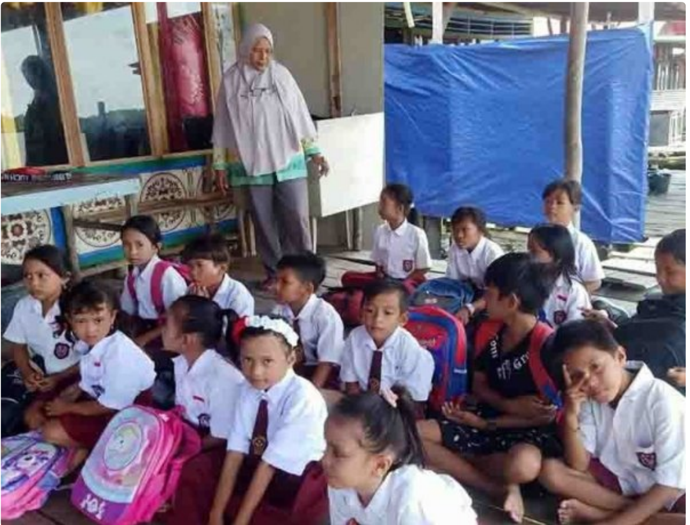
Pengabdian Seorang Guru di Desa Terpencil

LAMPUNG - Peringatan hari guru tahun ini semoga menjadi momentum yang tepat dan strategis untuk menatap masa depan pendidikan Indonesia yang lebih baik. Tantangan dan masalah yang sedemikian kompleks membutuhkan pemikiran yang mendalam. Guru sebagai garda terdepan harus terus menerus